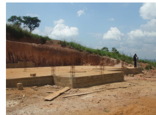
Sekundar & Berufsschule